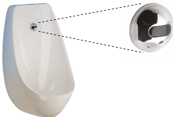
SLP 17 - DOMINO