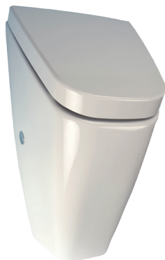
SLP 37 - VILA S POKLOPOM