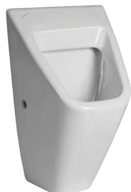
SLP 12 - VILA BEZ POKLOPU