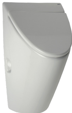
SLP 32 - ARQ S POKLOPOM