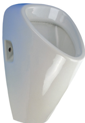
SLP 19 - GOLEM