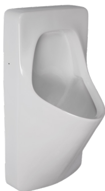
SLP 20 - ANTERO